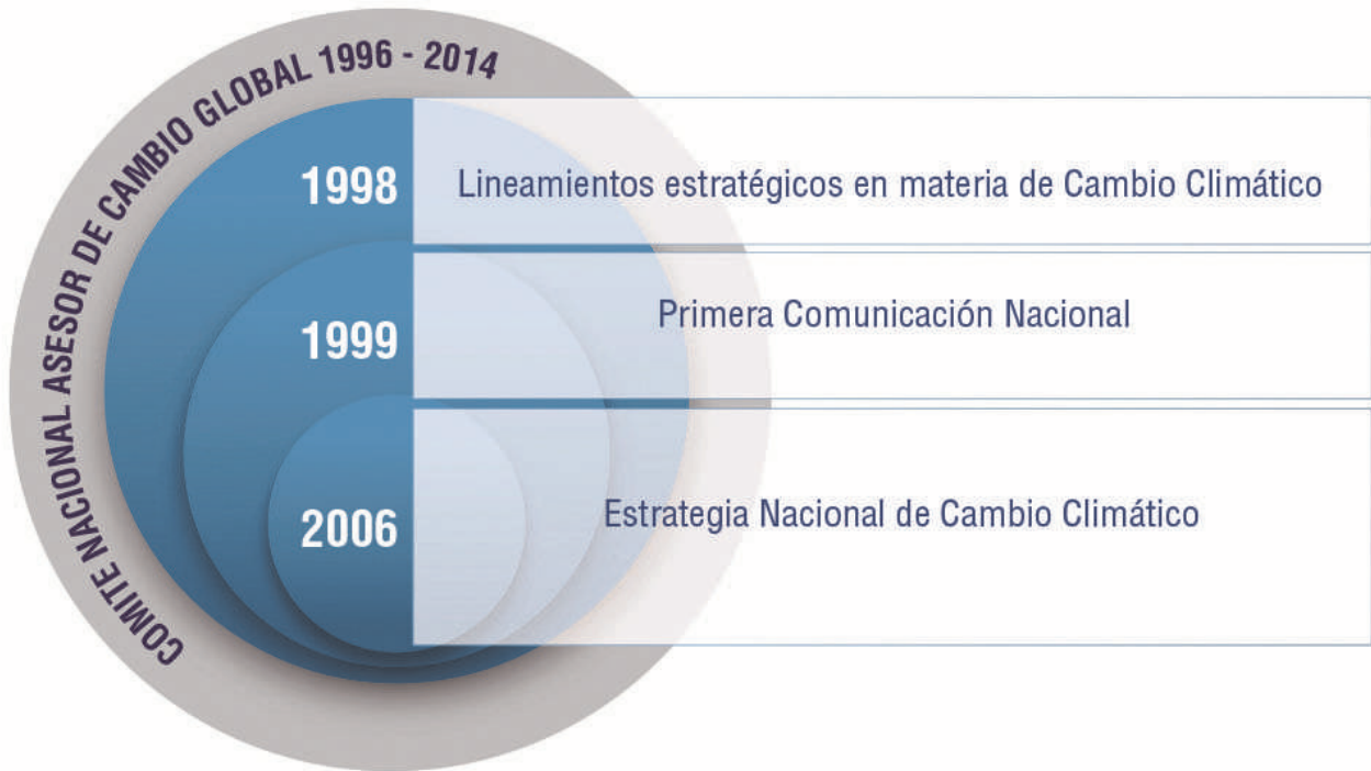
FIGURA N°1: BASES DE LA POLÍTICA DE CAMBIO CLIMÁTICO

La última sección de la Estrategia plantea dieciséis objetivos específicos: tres para mitigación y adaptación, respectivamente, y diez para creación y fomento de capacidades, señalándose que para cada objetivo se definirán líneas de acción en el futuro Plan de Acción.