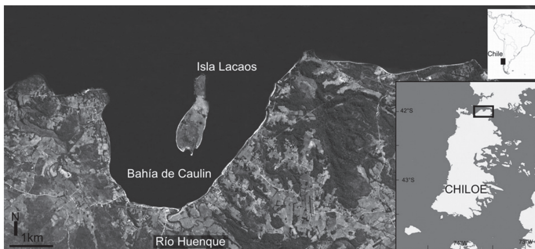
FIGURA 1. Ubicación geográfica del humedal marino de bahía Caulín, isla grande de Chiloé, sur de Chile.

Para cada especie de planta acuática colectada en el sitio de trabajo, se estudió su composición nutricional mediante análisis de humedad, proteínas, cenizas, fibra y extracto etéreo, según las metodologías utilizadas por el CEAL-Ulagos (< http://www.ceal.ulagos.cl >). Mientras que de forma paralela, para estas mismas especies se estudió su textura mediante mediciones de dureza, adhesividad y elasticidad en sus tejidos, utilizando para ello el instrumento LFRA Texture Analyzer (Brookfield Texture Pro Lite).